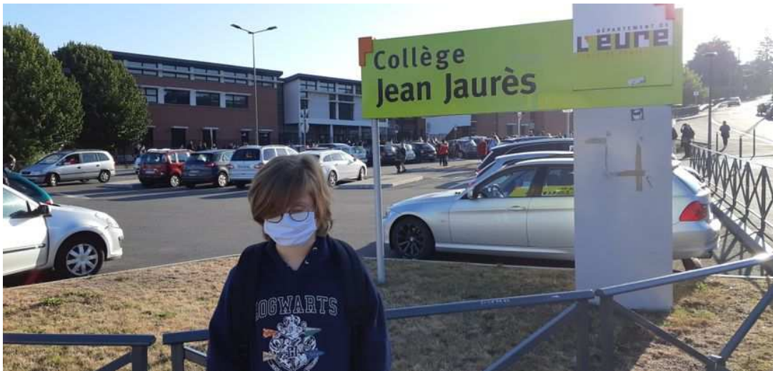
Photo souvenir pour France Bleu devant le collège Jean Jaurès à Évreux, où Paul devrait passer quatre ans, si tout va bien