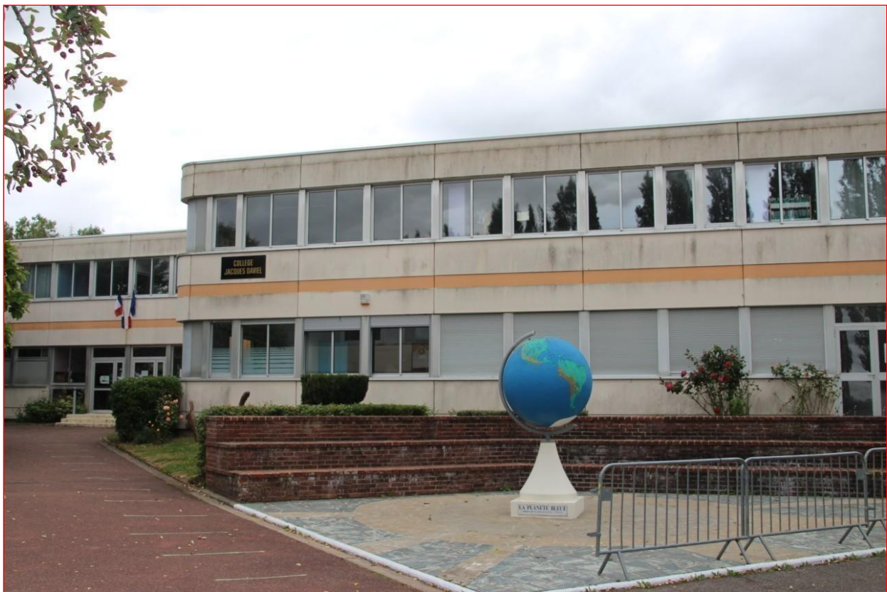
L'ancien collège Jacques Daviel sera lui démolir.