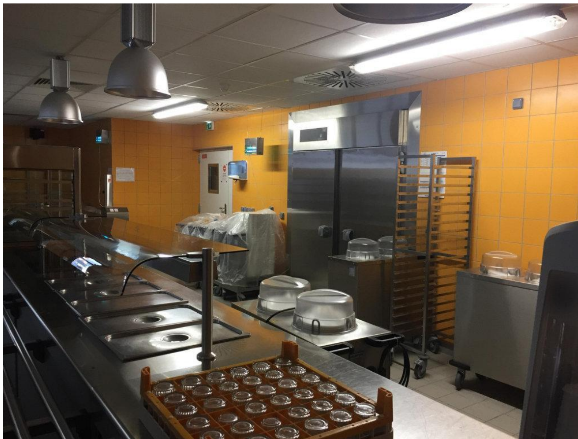
Une inondation dans les cuisines du collège a privé les élèves de repas chaud, jeudi 5 décembre, à Buchy.