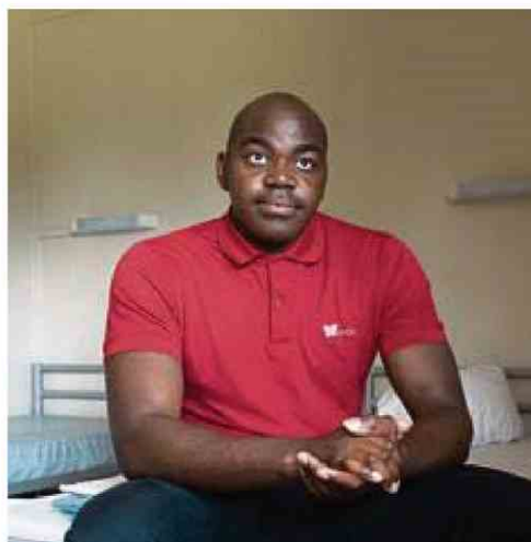
Paulin, à Montry (Seine-et-Marne), le 11 juin.