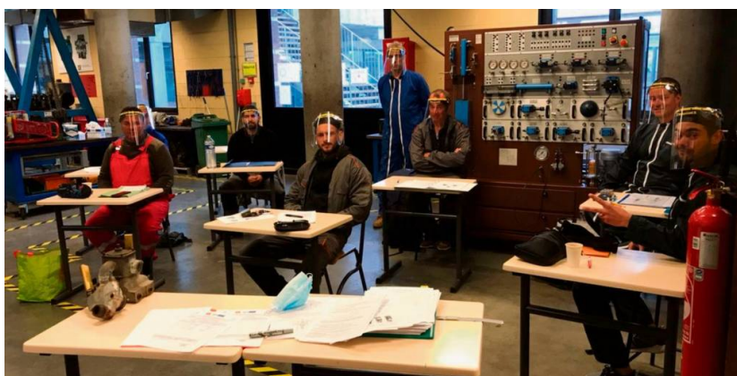
Lors des cours en travaux pratiques, la prudence reste de mise.