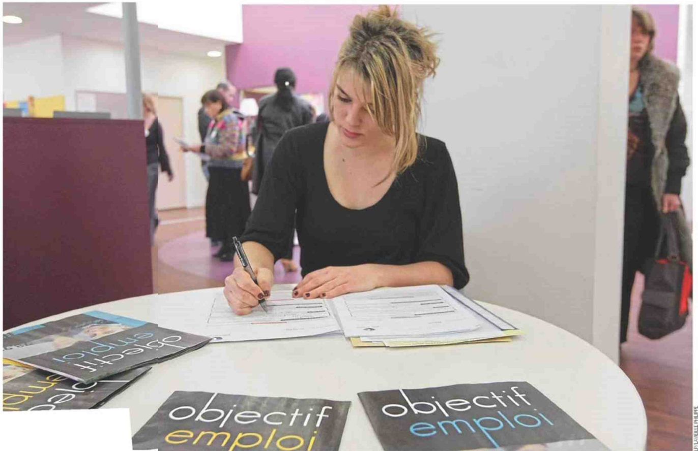
Illustration. L'Organisation internationale du travail estime que plus d'un jeune sur six en France n'a pas pu travailler depuis le début de la pandémie de Covid-19.