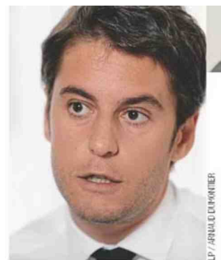
L.P. / ARIANO DI MONTIER

Depuis dix ans, le service civique s'est imposé comme un levier d'insertion dans l'emploi