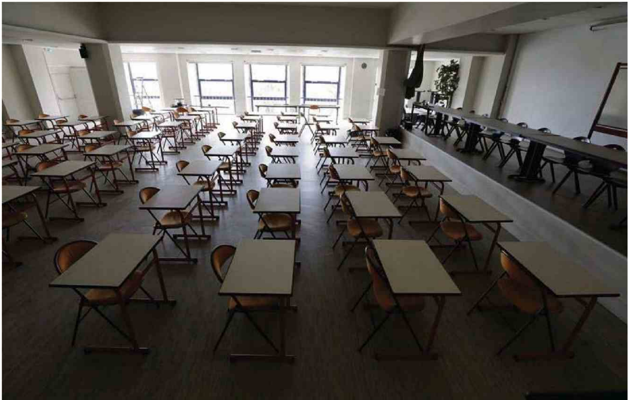
Au lycée du Parc- Impérial, à Nice, le 28 avril.