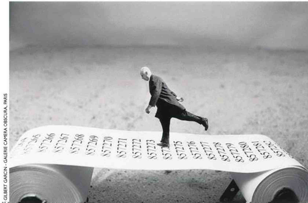
© GILBERT GARCIN - GALERIE CAMERA OBSCURA, PARIS