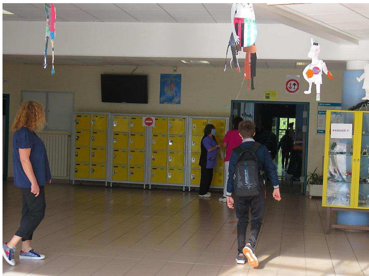
Les élèves entrent un à un, en respectant les gestes barrières et la distanciation sociale pour rejoindre leurs classes respectives.