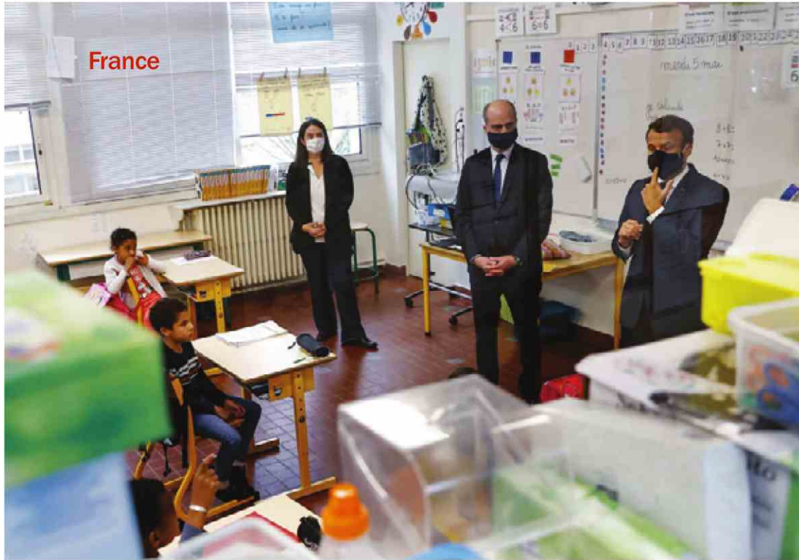
Jean-Michel Blanquer et Emmanuel Macron, en visite à l'école Pierre de Ronsard, à Poissy (Yvelines), le 5 mai. « Dans la vie d'un enfant, ne pas aller à l'école est très traumatisant. On a besoin de faire revenir progressivement les enfants à l'école », a déclaré le chef de l'Etat.