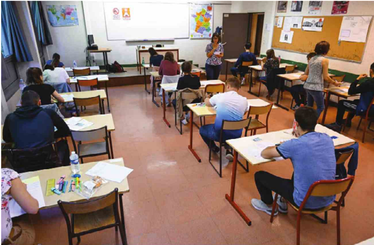
Epreuve de philosophie du bac 2019 dans un lycée de Compiègne (Oise). Avec le confinement, la réforme du contrôle continu s'est imposée avec un an d'avance sur le calendrier du ministère.