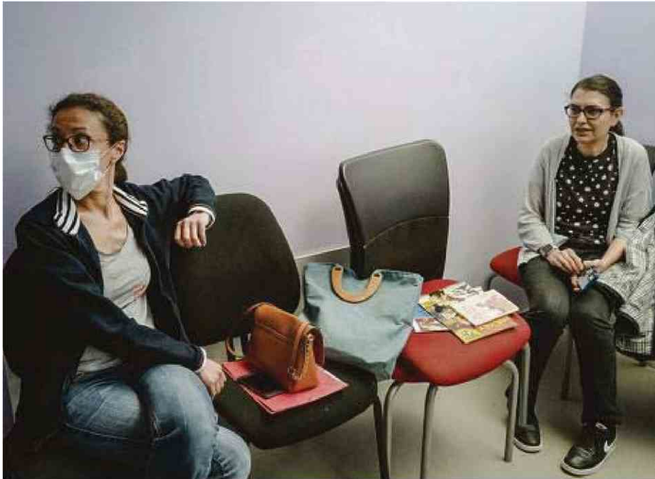
Une avocate de suspect et une psychologue venue pour une expertise psy.