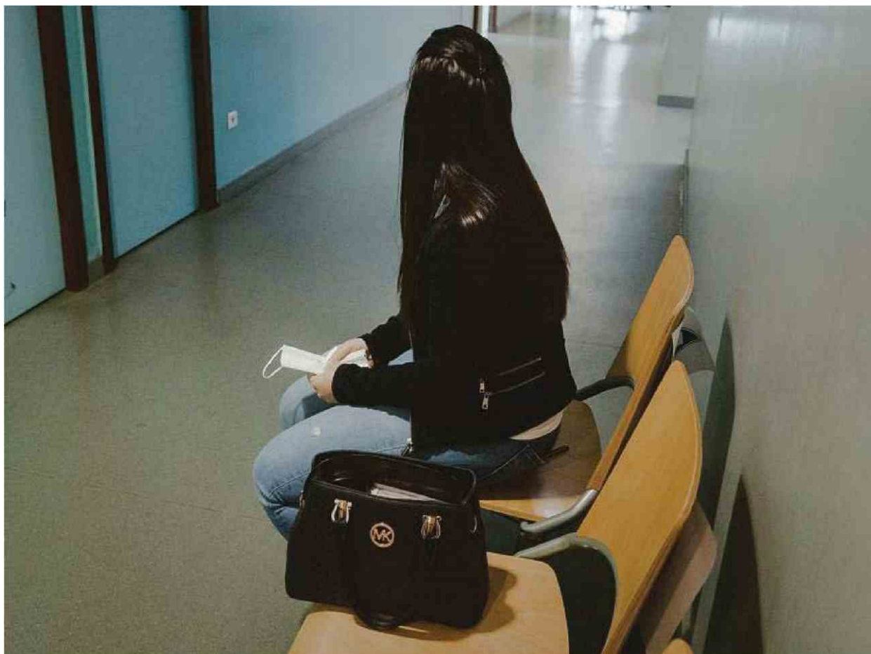
Au commissariat central de Lille, le 23 avril, une victime de violences conjugales attend pour une confrontation avec le mis en cause.