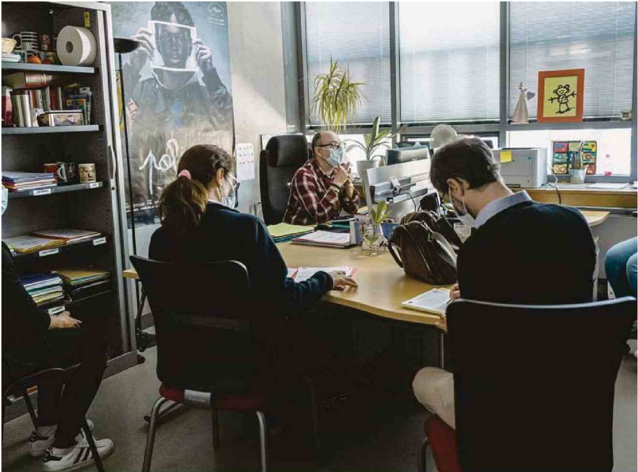
Les avocats du suspect et de la victime dans le bureau d'un enquêteur de la brigade des mineurs de Lille, le 23 avril.