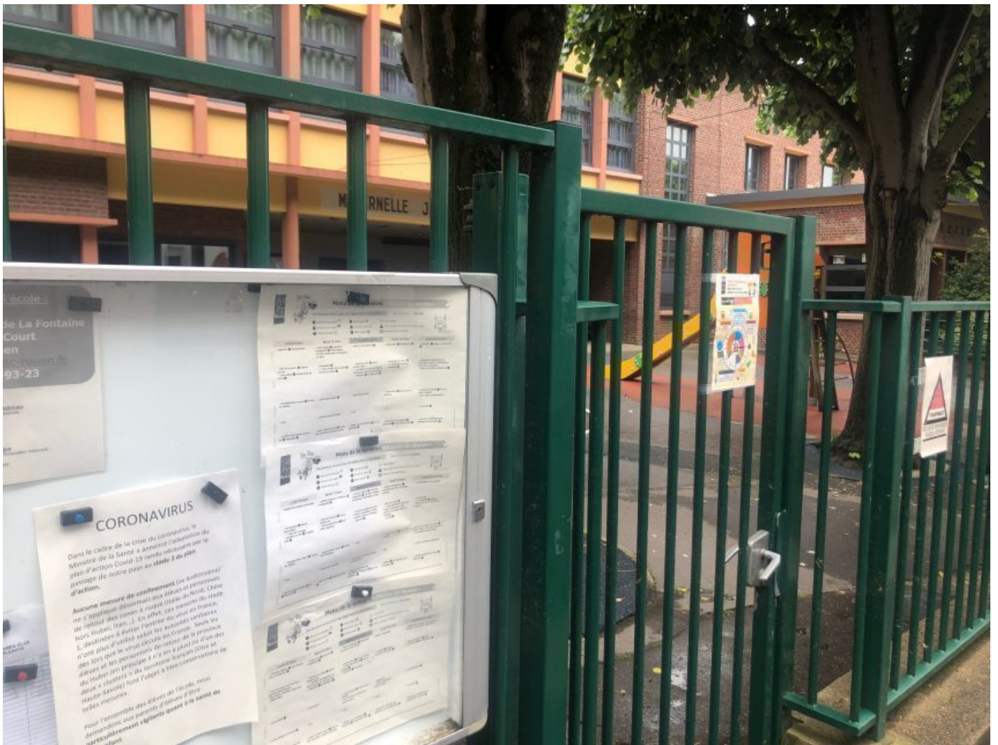
À Rouen, les écoles élémentaires n'ouvriront qu'à partir du 25 mai 2020.

La municipalité menée par le maire Yvon Robert a présenté un plan concernant l' ouverture des écoles lors du déconfinement . Ce plan sera présenté mercredi 6 mai 2020, au comité d'hygiène, de sécurité et des conditions de travail (CHSCT) de la Ville. Il prévoit une ouverture progressive des classes à partir du lundi 25 mai.