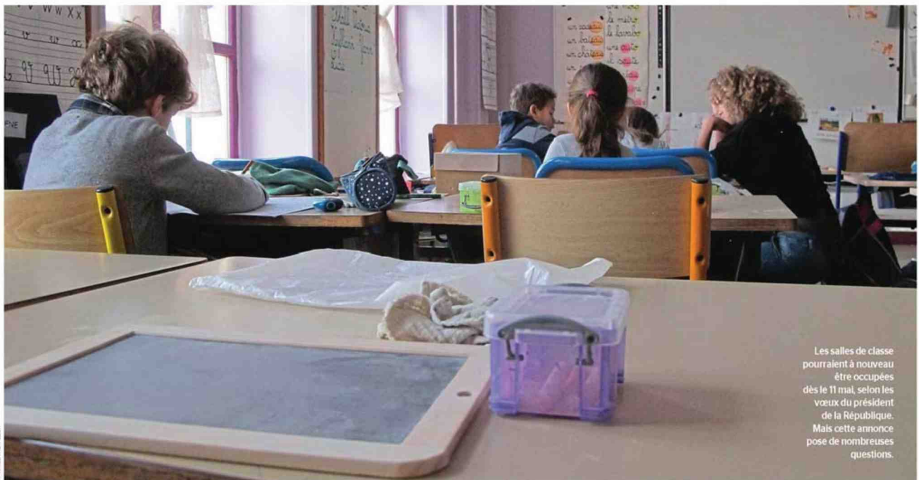
Les salles de classe pourraient à nouveau être occupées dès le 11 mai, selon les vœux du président de la République. Mais cette annonce pose de nombreuses questions.