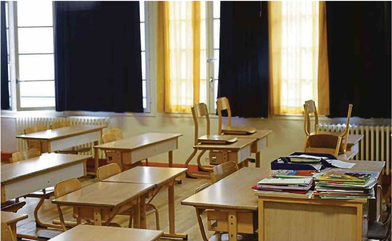
Une classe vide à Paris, lundi 16 mars. Le souci majeur reste d'entrer en contact avec les parents des élèves, notamment ceux qui ne parlent pas le français.