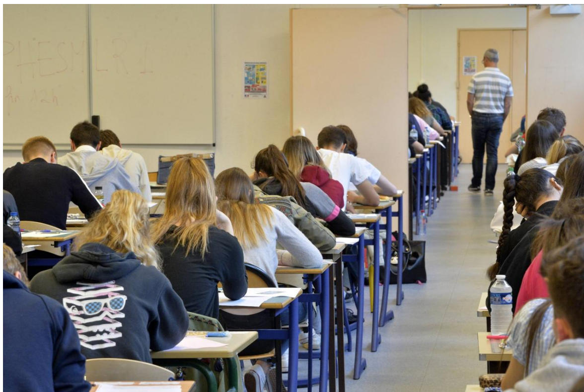
L'épreuve du bac de philosophie en 2018, au lycée Dupuy-de-Lôme à Lorient (Morbihan).

Taux de réussite au bac, taux de mention... Pour la 27 e année, le ministère de l'Éducation nationale publie ce mercredi 18 mars les « indicateurs de valeur ajoutée des lycées ». En comparant des lycées qui se ressemblent, cet outil permet d'évaluer la capacité de chaque établissement à emmener leurs élèves jusqu'au baccalauréat et donc à estimer leur performance.