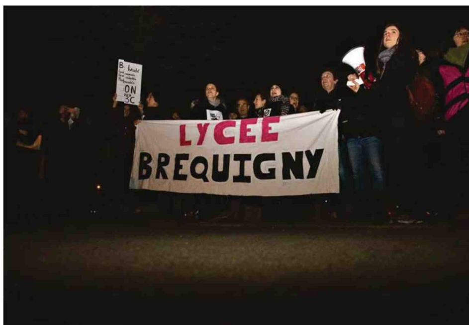
A Rennes, mercredi, jour d'épreuves de contrôle continu du bac, devant le lycée Victor-et-Hélène-Basch.