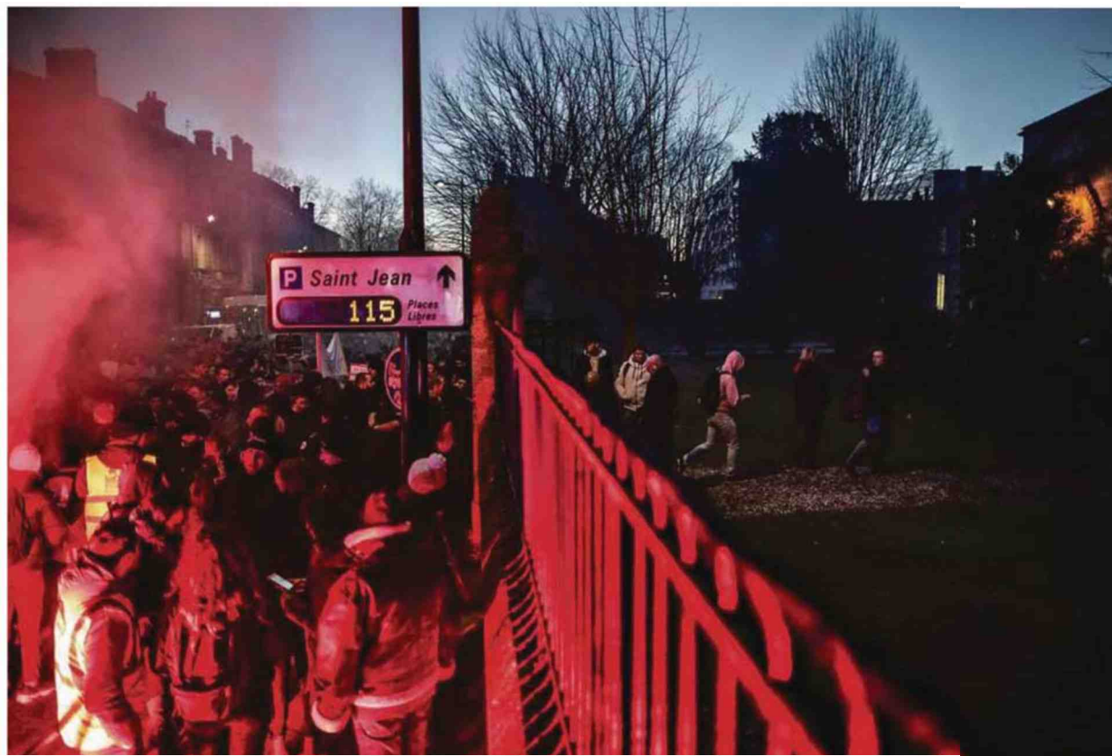
Des lycéens et enseignants protestent contre la réforme du bac devant le lycée Gustave-Eiffel, à Bordeaux, le 20 janvier. PHOTOS