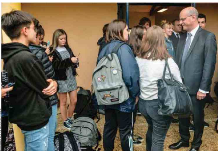
Visite de Jean-Michel Blanquer dans un lycée à Charlieu (Loire), en octobre. Le ministre de l'Éducation nationale a mis en place un « comité de suivi » chargé de faire remonter les difficultés liées à la réforme du bac.