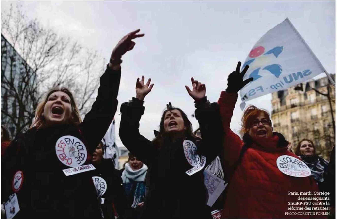
Paris, mardi. Cortège des enseignants Snuipp-FSU contre la réforme des retraites.