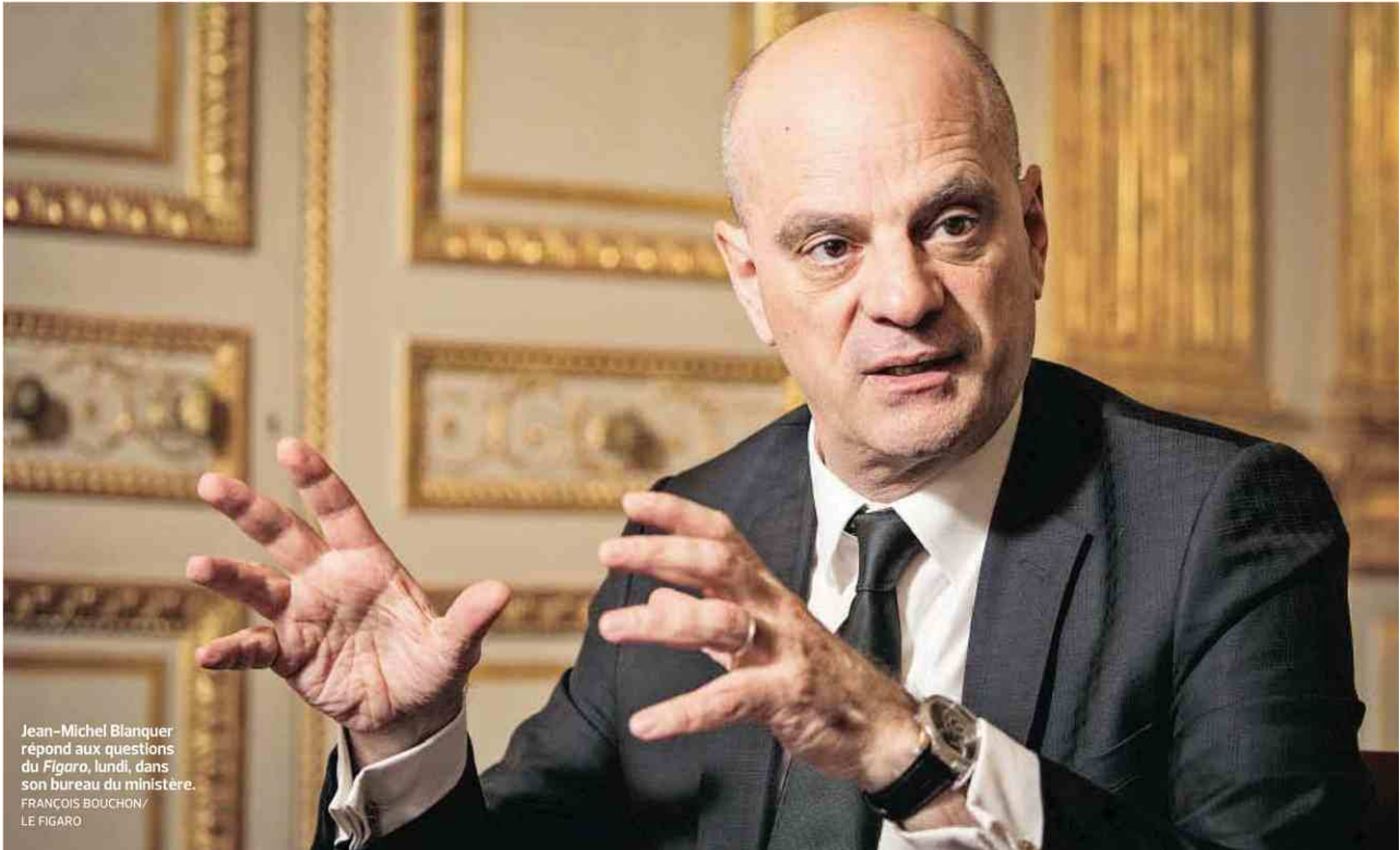
Jean-Michel Blanquer répond aux questions du Figaro , lundi, dans son bureau du ministère.