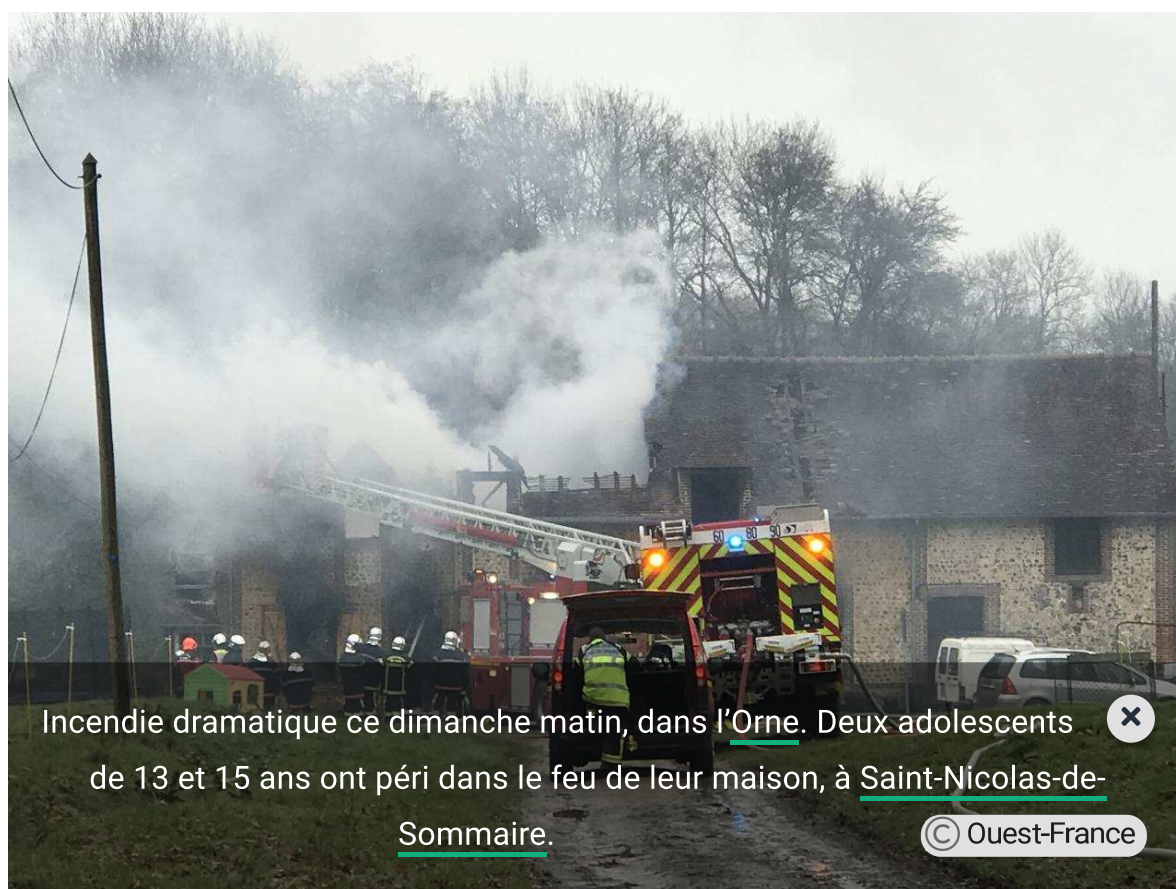
Incendie dramatique ce dimanche matin, dans l' Orne . Deux adolescents de 13 et 15 ans ont péri dans le feu de leur maison, à Saint-Nicolas-de-Sommaire .

De nombreux sapeurs-pompiers sont intervenus dès 6 h 15, et sont encore engagés sur le lieu du dramatique sinistre, ce dimanche midi.