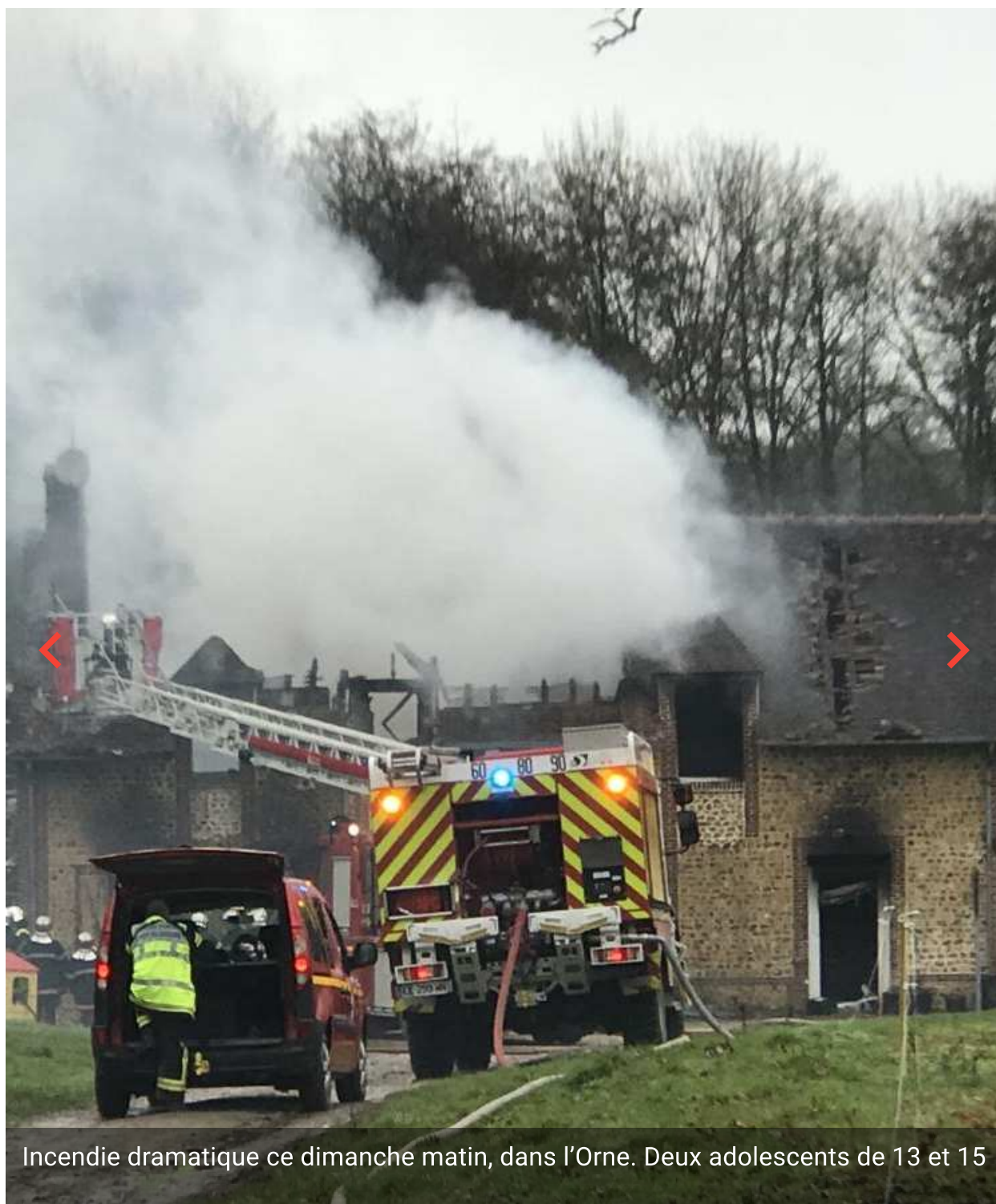
Incendie dramatique ce dimanche matin, dans l'Orne. Deux adolescents de 13 et 15