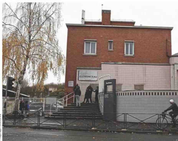
Villemombre, hier. Les cours, suspendus après le drame, devraient reprendre ce matin.