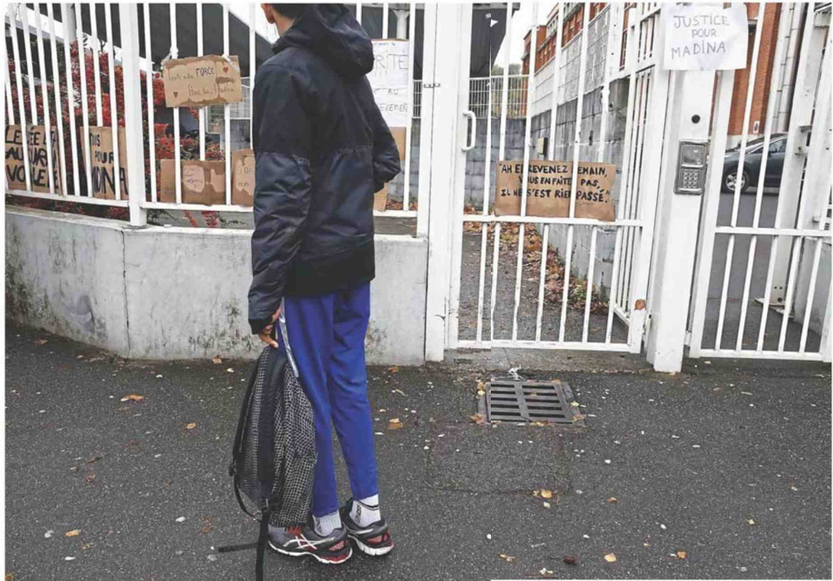
Villemomble (Seine-Saint-Denis), hier. Devant le lycée Georges-Clemenceau, où une jeune fille a tenté de s'immoler par le feu lundi, de nombreux élèves, sous le choc, hésitaient à entrer.