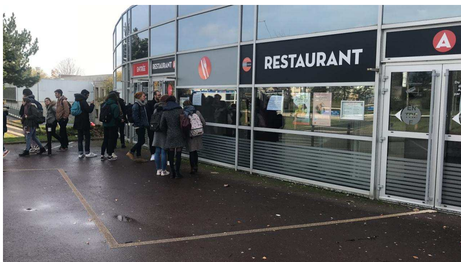
Les étudiants trouvent portes closes devant les restaurants universitaires du Campus 1, ce vendredi midi.

La décision a été prise ce vendredi matin 22 novembre 2019. En raison d'une manifestation d'étudiants ce midi sur le campus 1, le Centre régional des œuvres universitaires et scolaires (Crous), en charge des structures de restauration de l'université, a pris la décision de fermer les restaurants universitaires (RU). Pour la journée. Par crainte de débordements.