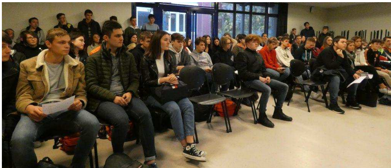
Tous les élèves de première ont participé à cette rencontre.