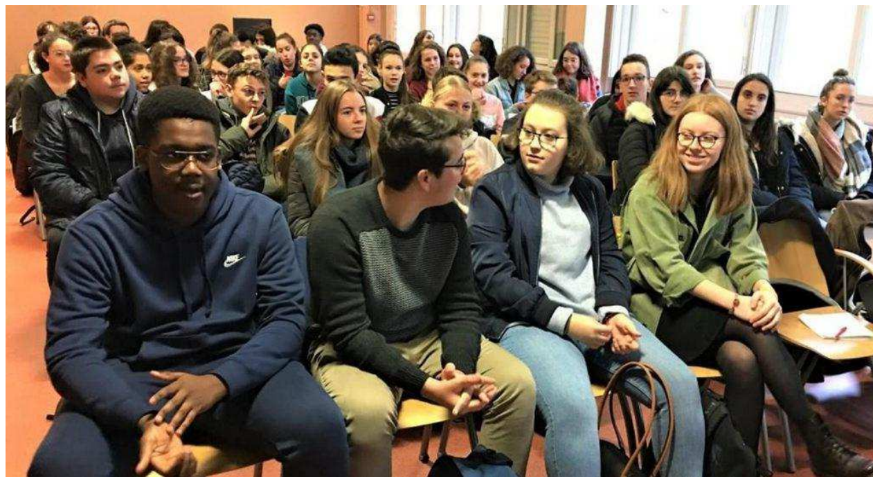
Les élèves de la classe de seconde 4 ont rencontré le metteur en scène Pierre-Emmanuel Rousseau vendredi dernier.