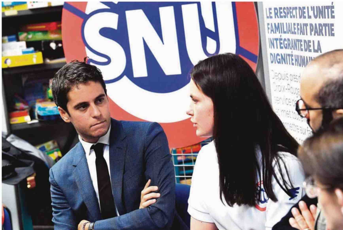
Le secrétaire d'État Gabriel Attal avec des jeunes volontaires du service national universel, fin octobre à Lille.