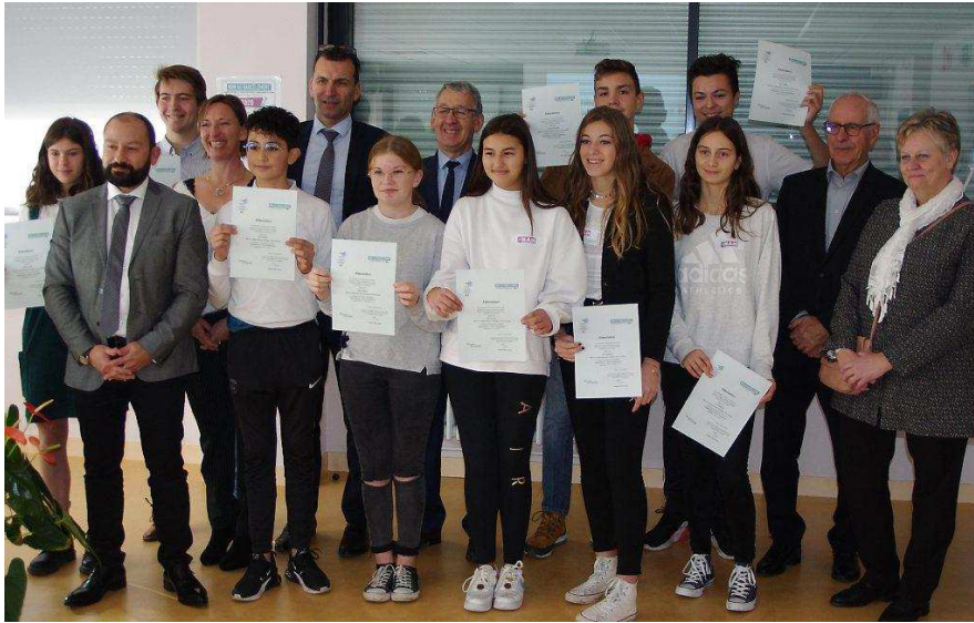
Les ambassadeurs primés félicités pour leur engagement.