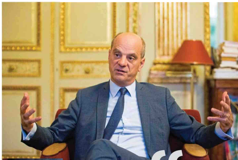
Paris (VII e ), hier. Jean-Michel Blanquer a dû gérer trois crises au mois de juin : « Les menaces sur le déroulement de l'épreuve du baccalauréat, la crise liée à la chaleur pour le brevet, puis celle des correcteurs. »

dans la rue cet hiver dans le sillage des Gilets jaunes, s'empilent des inquiétudes plus prosaïques. La réforme, qui met fin aux traditionnelles filières générales, rebat le contenu des cours et les emplois du temps, des professeurs comme des élèves. Les enseignants du lycée, ainsi, doivent non seulement diriger de nouveaux programmes, mais aussi adapter de nouvelles disciplines créées de toutes pièces cette année, comme la spécialité numérique et science informatique. A la clé, selon eux : une charge de travail supplémentaire, sans compensation. CH.B.