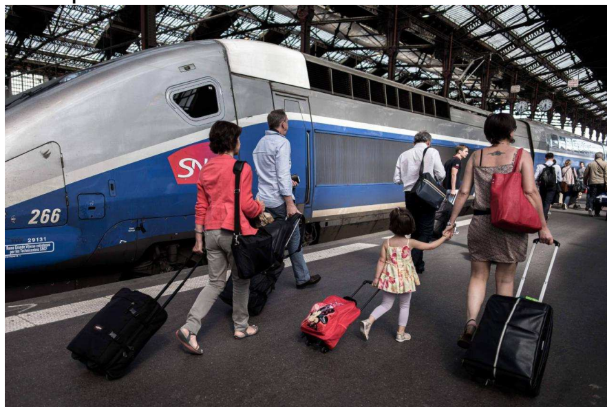
Partir en vacances avant la fin des cours pour payer moins cher ? Nombre de parents y pensent.

Avant chaque période de congés, il n'est pas rare que des élèves manquent à l'appel en classe, leur famille partant plus tôt en vacances. Or, l'assiduité scolaire est une obligation. Un père de famille vendéen a été sanctionné de deux amendes de 135 € parce qu'il avait fait manquer deux fois l'école à sa fille pour pouvoir prendre des vacances décalées. La première fois sa fille était en grande section, la seconde fois en CP. Fallait-il le sanctionner ? Les avis sont partagés.