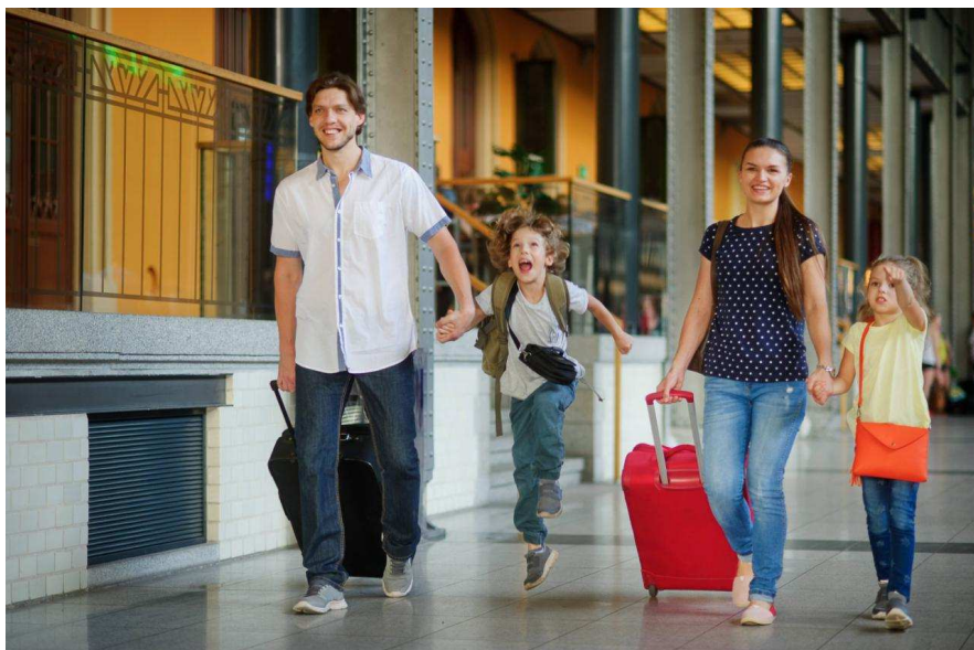
«Ne faut il pas mieux passer du temps dans de bonnes conditions avec ses enfants quitte à leurs manquer quelques heures de cours ?»