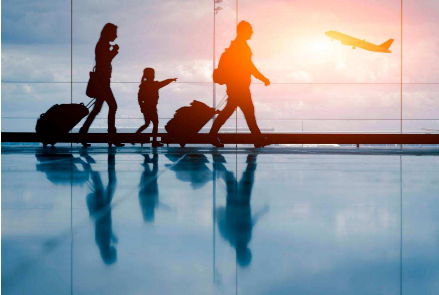
«Une semaine d'absence ne pénalise en rien un enfant.»