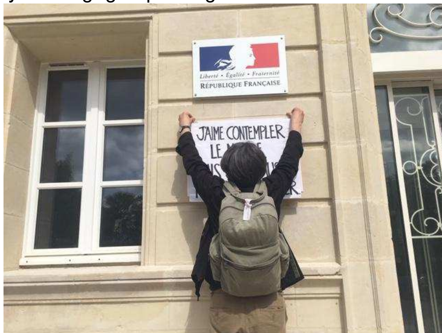
Les professeurs de philosophie de l'académie de Caen se sont rassemblés, lundi 1er juillet 2019, lors de leur premier jour de grève contre la réforme des lycées.

Ce lundi 1er juillet 2019, les professeurs de philosophie se sont rassemblés devant le rectorat de Caen, entamant ainsi leur premier jour de grève. Ils protestent contre la réforme du lycée engagée par le gouvernement.