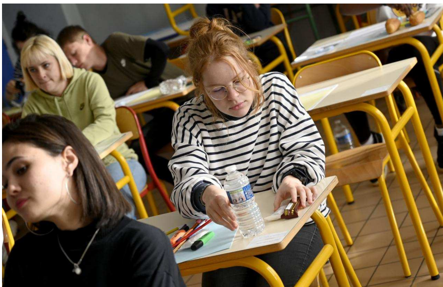
Ce lundi 17 juin, des milliers de candidats au baccalauréat passent leur première épreuve écrite, de philosophie ou de français comme ici à Caen au lycée Malherbe.

C'est parti pour la philosophie ! Au lycée Malherbe de Caen, l'un des plus gros centres d'examen de la région avec 795 candidats, comme dans toute la Normandie, les épreuves du bac ont démarré ce lundi 17 juin 2019.