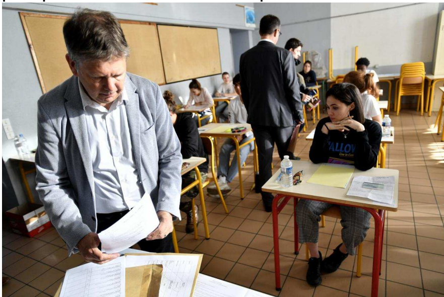
Ce lundi 17 juin, des milliers de candidats au baccalauréat passent leur première épreuve écrite, de philosophie ou de français comme ici à Caen au lycée Malherbe.

C'est parti pour la philosophie ! Depuis 8 h, les bacheliers planchent sur la traditionnelle première épreuve. En Normandie, 36 284 élèves passent le bac cette année. C'est un peu plus que l'an dernier. Pour le moment rien à signaler, la grève n'a pas perturbé le début des épreuves selon la rectrice.