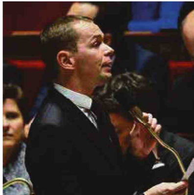
Le secrétaire d'Etat, Olivier Dussopt