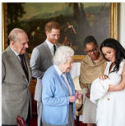
Le royal baby s'appelle Archie