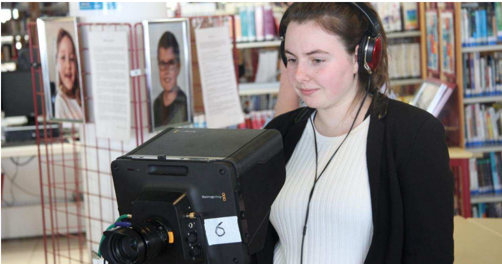
Une autre élève à la caméra.