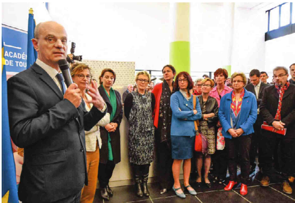
Jean-Michel Blanquer au rectorat d'Occitanie, à Toulouse. La fusion des régions en 2015 a créé un « super recteur » sans autorité hiérarchique ni budget. Un doublon dont ne veut plus le ministre de l'Education nationale, qui va réduire de 30 à 13 le nombre de rectorats d'ici à 2021.

ils ne seront plus que 13 en 2021. La Normandie mène l'expérimentation depuis 2017. « On veut montrer que l'Education nationale se modernise, sans désespérer les territoires », annonce le premier recteur fusionné, Denis Rolland, très excité par la tâche.