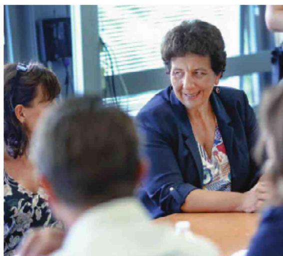
Frédérique Vidal rencontre la commission d'accès à l'enseignement supérieur de l'Académie de Lille, le 30 août. Pour le ministère, « Parcoursup fonctionne ».