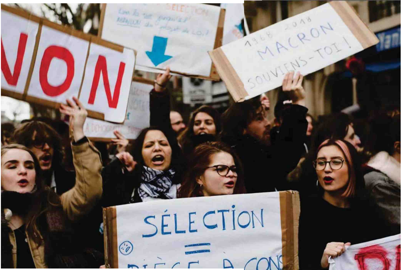
Le 2 février à Paris. Aucune étude d'impact n'a été réalisée avant la mise en œuvre de Parcoursup, qui est entré en vigueur alors que le texte n'avait pas encore été voté.