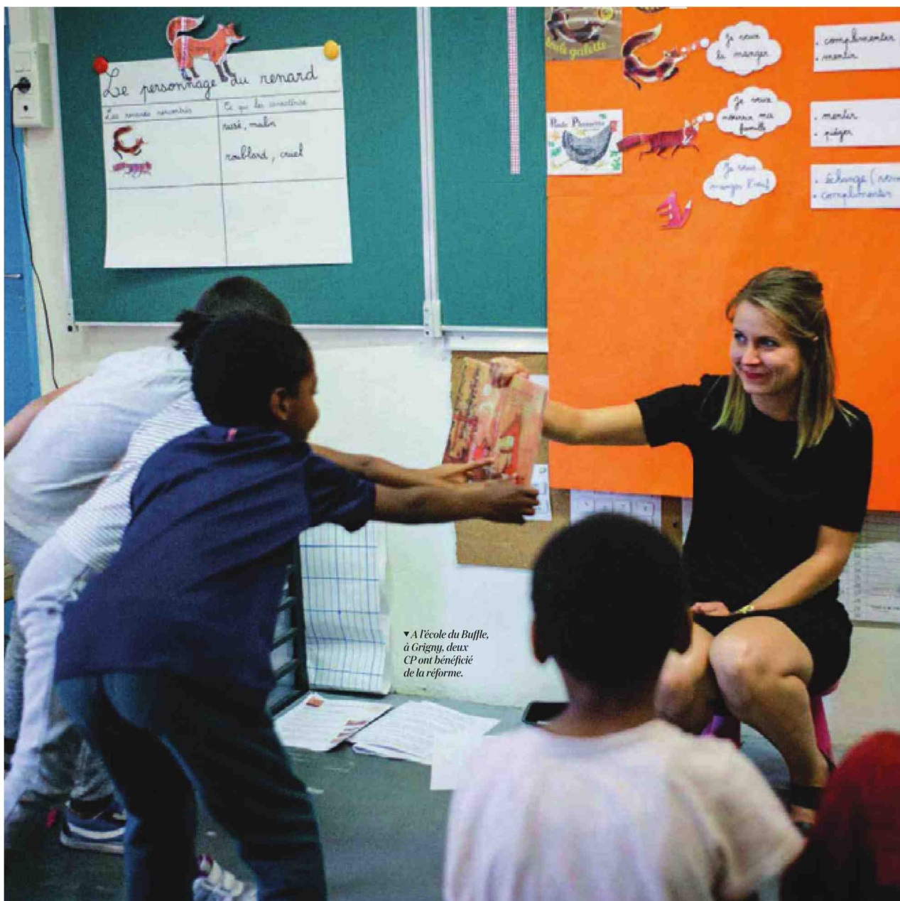
▼ A l'école du Buffle, à Grigny, deux CP ont bénéficié de la réforme.