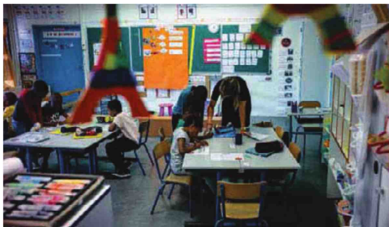
▲ Les classes sont organisées en îlots, de manière à favoriser l'autonomie des élèves.