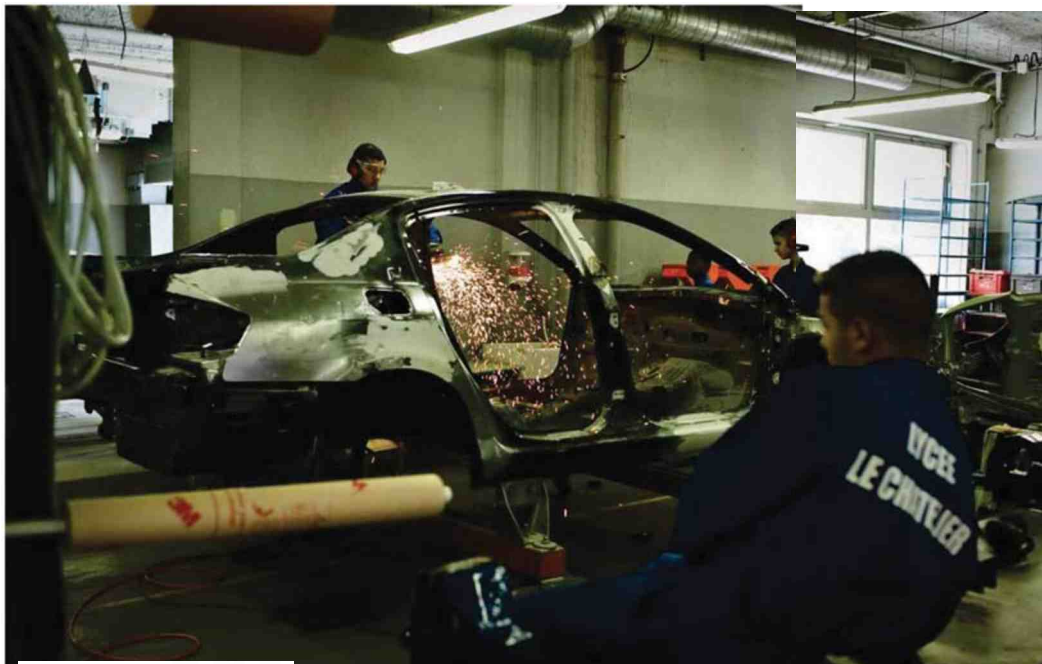
Dans l'atelier de carrosserie du lycée professionnel Le Chatelier à Marseille, le 17 septembre 2013.

Autre mesure annoncée: «Un oral au bac pour que l'élève parle de son chef-d'œuvre réalisé dans l'année», dit le ministre, qui veut ainsi «cultiver la fierté». Il a aussi promis d'ouvrir 2 000 places en BTS. Très critique, le Snuep-FSU estime que toutes ces annonces, «même celles qui apparaissent comme positives», cachent une autre finalité de la réforme. Budgétaire, cette fois: «A regarder de près la grille horaire, il semble surtout que le ministère cherche à faire des économies: 16% d'heures de mathématiques en moins sur trois ans, 13% en lettres-histoire... On a fait le calcul, cela reviendrait à supprimer 5 000 postes d'enseignants.» ◀