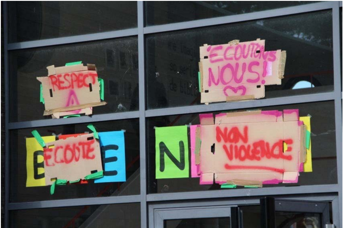
Quelques slogans accrochés sur la devanture du lycée d'Hérouville, près de Caen (Calvados).

Il y a eu plusieurs tentatives de blocages mercredi aux lycées Rostand, Victor-Hugo, Allende, Malherbe et au CLE, mais seuls les deux derniers lycées ont réussi. Une délégation a été reçue cinq minutes lors du conseil d'administration mais ça s'est mal passé, ils ont été méprisants, en nous disant qu'ils se fichaient de la réforme, que ça n'était pas à l'ordre du jour »