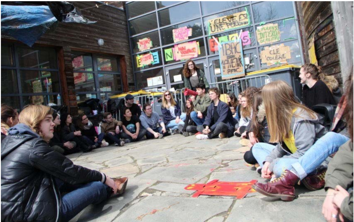
Depuis mercredi, des élèves du Collège Lycée Expérimental (CLE) basé à Hérouville, près de Caen, bloquent l'accès au lycée, et non au collège, pour protester contre les réformes concernant le baccalauréat et l'entrée à l'université.