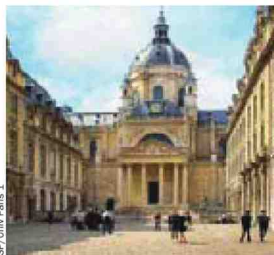
La Sorbonne. Avec Parcoursup, les facs vont devoir fournir capacité d'accueil, taux de réussite et d'insertion.