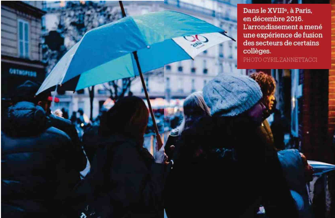
Dans le XVIII e , à Paris, en décembre 2016. L'arrondissement a mené une expérience de fusion des secteurs de certains collèges.