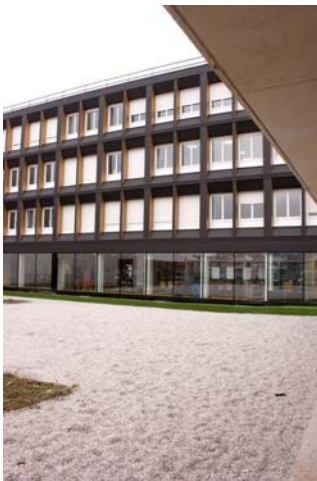
Entrée du collège Marcel Pagnol de Caen

Pour inverser une tendance à la baisse des effectifs du collège Marcel-Pagnol de Caen, et alors qu'un collège du centre-ville a dû fermer ses portes, le département du Calvados a fait le pari d'une réhabilitation des locaux en partenariat étroit avec l'académie. La revalorisation de ce collège REP +, le seul du département, prend appui sur l'arrivée d'une nouvelle équipe de direction et sur des enseignants engagés dans la rénovation pédagogique. Interrogés le 9 janvier 2018 par AEF, les représentants de la collectivité, de l'académie de Caen et de l'établissement témoignent d'une "volonté d'avancer ensemble" sur la base de projets décidés en concertation avec les personnels. L'attribution du label REP + et le contexte de la réforme du collège encouragent aussi à "repenser les pratiques", de même que la diffusion d'outils numériques par dotations et appel à projets "collèges lab".