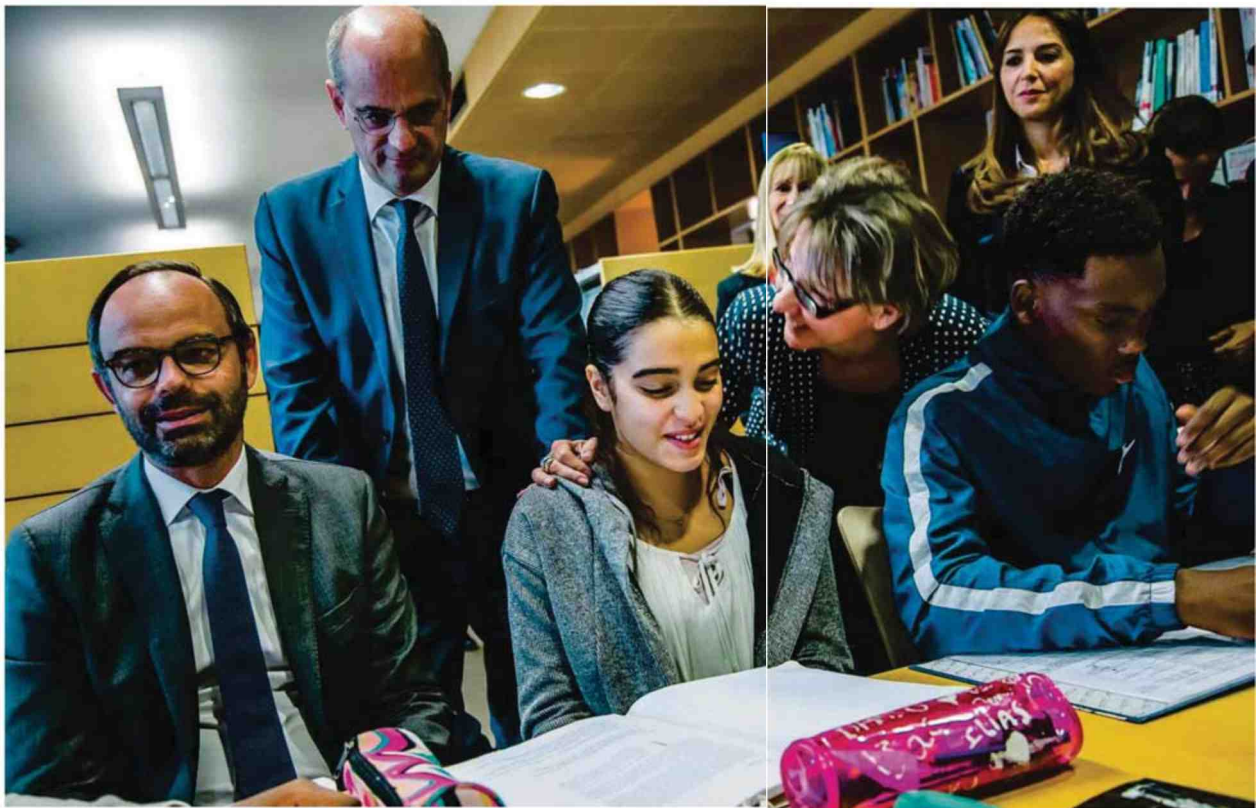
Edouard Philippe et Jean-Michel Blanquer au collège Jean-Perrin de Nanterre, le 7 novembre, pour le lancement du dispositif «Devoirs faits».