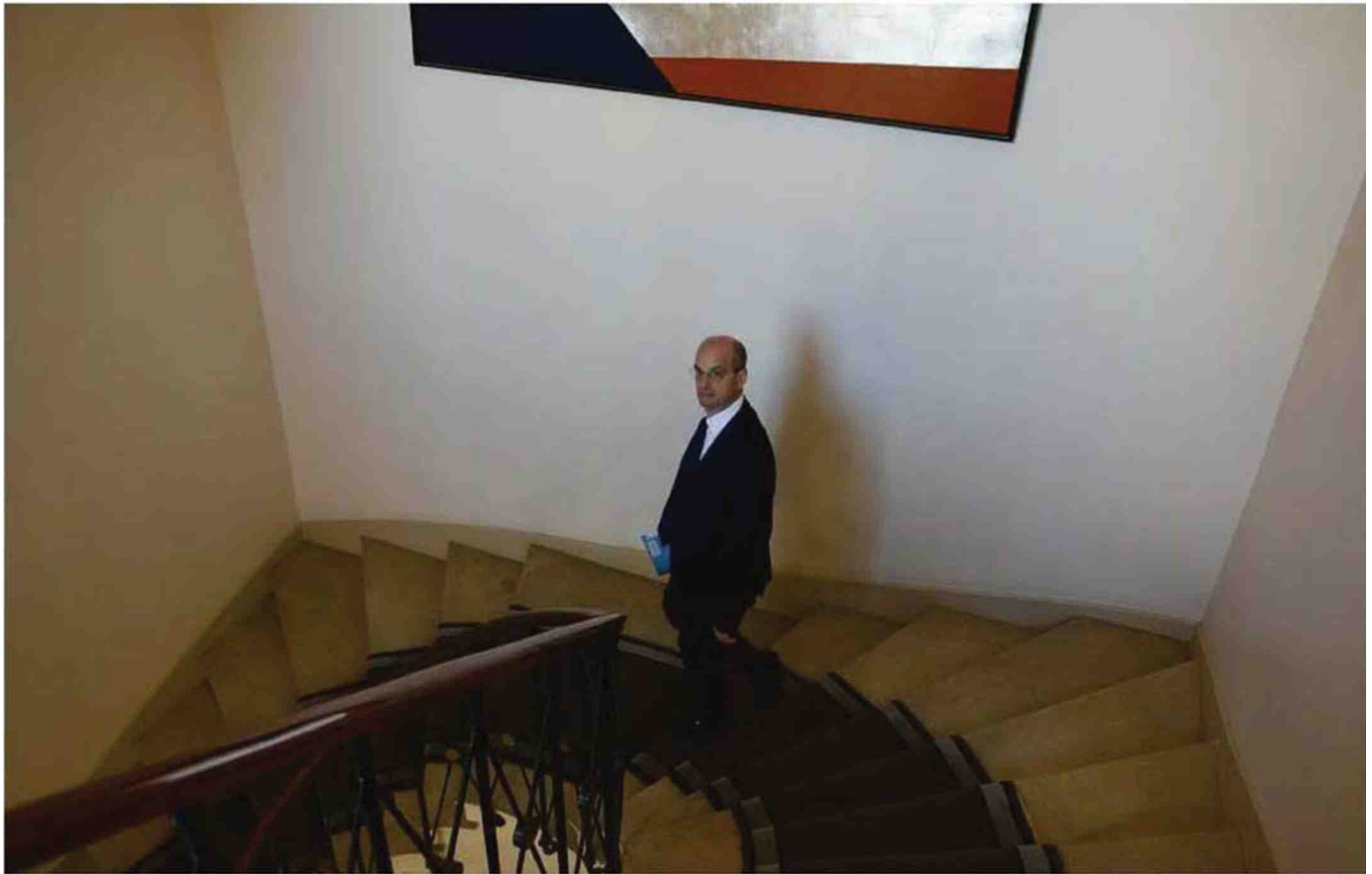
Jean-Michel Blanquer au ministère de l'Education nationale, le 30 octobre.