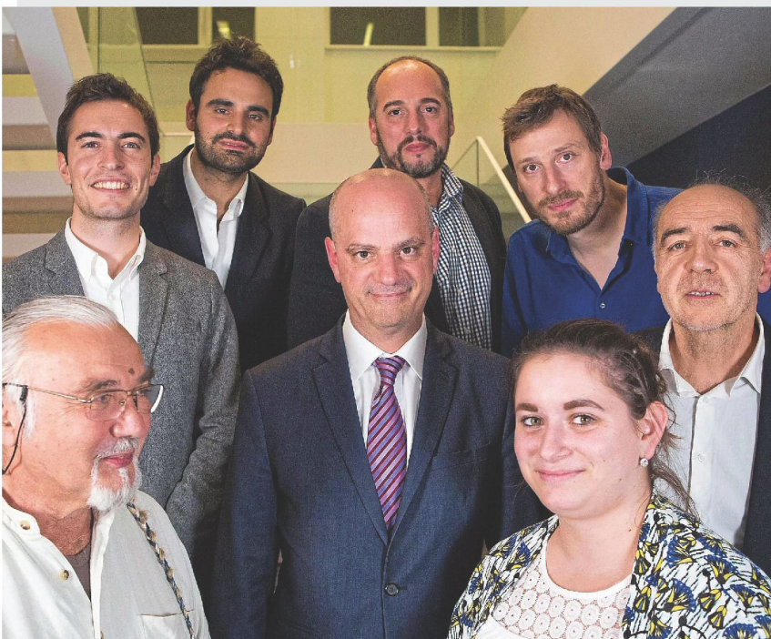
Boulevard de Grenelle (Paris XV e ), vendredi soir. Jean-Michel Blanquer, le ministre de l'Education nationale, entouré de nos lecteurs, au siège de notre journal.