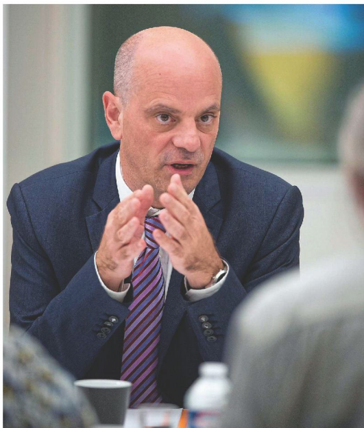
« a é k p J

C'est vrai qu'il communique facilement. Vous savez, vous pouvez tout à fait éteindre votre portable, je ne pense pas qu'il vous le reproche. Il doit peu dormir, pourtant il a l'air d'être toujours en forme. J'étais récemment en Guyane avec lui. Malgré les très fortes chaleurs, le décalage horaire, le voyage en avion, il était frais et disponible dès notre arrivée, capable d'enchaîner les réunions techniques de trois heures, de rester des heures à discuter sous le soleil et, après tout ça, vous avez toujours l'impression qu'il vient de commencer sa journée.