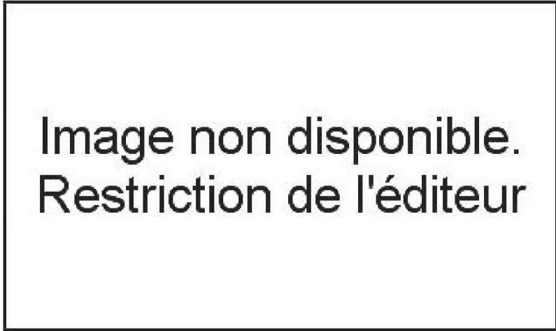
LA MATERNELLE , période clé de l'épanouissement de l'enfant. Ici, à Montpellier.

J.J. : A l'inverse, je ne suis pas sûr qu'introduire systématiquement dans l'école le système des valeurs de la société soit une bonne méthode. Par exemple, il faut lutter contre le racisme, bien sûr. Mais intégrer tel quel dans l'école ce débat qui ne se pose pas, parce que les jeunes enfants ne sont pas spontanément racistes, peut être contre-productif. Autre exemple : est-ce qu'introduire à l'école les débats à propos de la naissance, de la filiation, de l'appartenance à un sexe, tous ces problèmes d'adultes, ne contribue pas à diviser l'école au lieu d'y faire régner le respect ? Car l'enfant a un potentiel spontané d'empathie. Lui expliquer qu'un Noir et un Blanc sont deux êtres humains également respectables, etc., bref, prendre le langage de la société adulte, c'est courir le risque de détruire cette empathie au profit d'une controverse politisée. Ne faut-il pas repenser une espèce d'anthropologie pour l'enfant plutôt que de mettre en