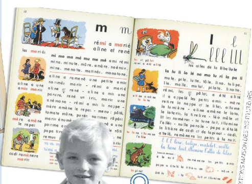
EDITIONS MAMBOUDES ANS ET LES MAMBOUS