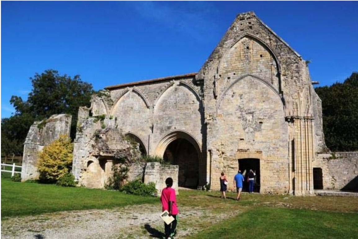
L'abbaye Sainte-Marie est à visiter ce week-end.

Abbaye Saint-Martin-de-Mondaye. Visite guidée : dimanche, de 15 h à 17 h 30. Tél. 02 31 92 58 11.