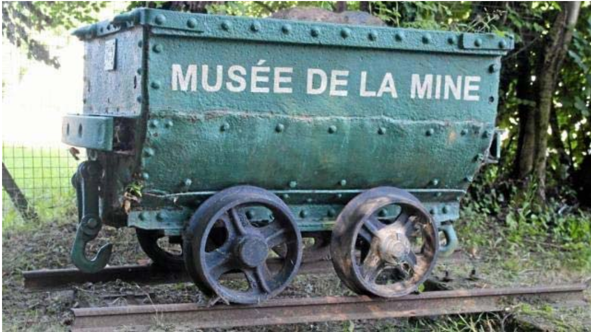
Le musée de la Mine accueillera le public ce week-end.

Moulin de Pontécoulant. Ancien logis du meunier. Visite guidée sur rendez-vous place de l'église : dimanche, de 15 h à 19 h. Tél. 02 31 68 32 36.