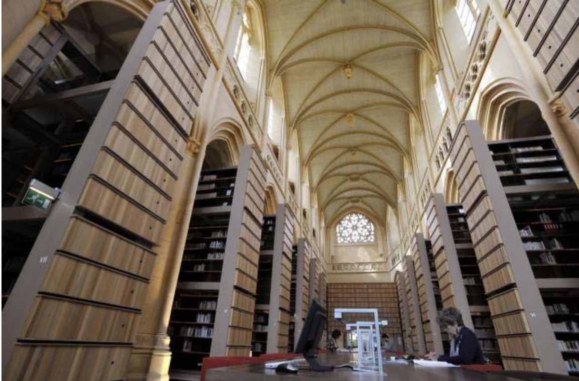
L'Institut mémoires de l'édition contemporaine (Imec) est ouvert au public ce week-end. | Archives Ouest-France

13 h et de 13 h 30 à 18 h 30. Tarif : 5 € et 3 € pour les moins de 10 ans. Tél. 02 31 96 63 10 ou sur www.musee-4commando.org