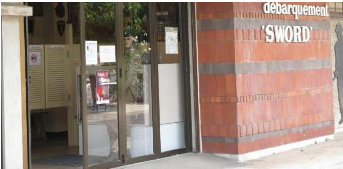
Le musée n°4 commando raconte le Débarquement.

Chapelle funéraire de la famille du Merle. Chapelle qui abrite la Vierge noire. Visite libre : samedi et dimanche, de 15 h à 17 h. Tél. 02 31 32 83 84.