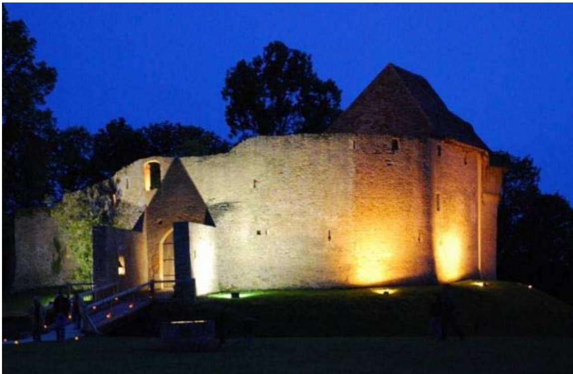
Le château de Crèvecœur-en-Auge sera ouvert ce week-end.

Palais Ducal. Artothèque, espace d'art contemporain. Impasse du Duc-Rollon. Visite libre de l'exposition de Stéphane Couturier, « Alger, Climat de France » : samedi et dimanche, de 14 h à 19 h. Visite guidée : samedi et dimanche, de 14 h 30 à 18 h 30. Performances chorégraphiques : samedi, de 15 h 30 à 16 h et de 17 h 15 à 18 h ; dimanche, de 11 h à 12 h et de 15 h 30 à 17 h 30. Tél. 02 31 85 69 73 - www.artotheque-caen.net