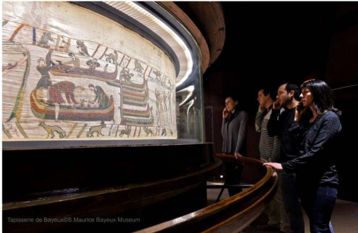
Le musée de la Tapisserie de Bayeux se visite pendant les Journées européennes du patrimoine.

Château. Visite guidée. Animations pour petits et grands, carrousel, concerts, magicien, parcours, feux d'artifice. Samedi, de 11 h à 01 h ; dimanche, de 11 h à 20 h. Tarif : 1 €. Tél. 02 31 21 06 76, www.chateau-balleroy.com