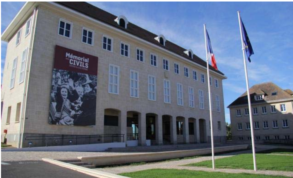
Le Mémorial des civils se visite ce week-end.