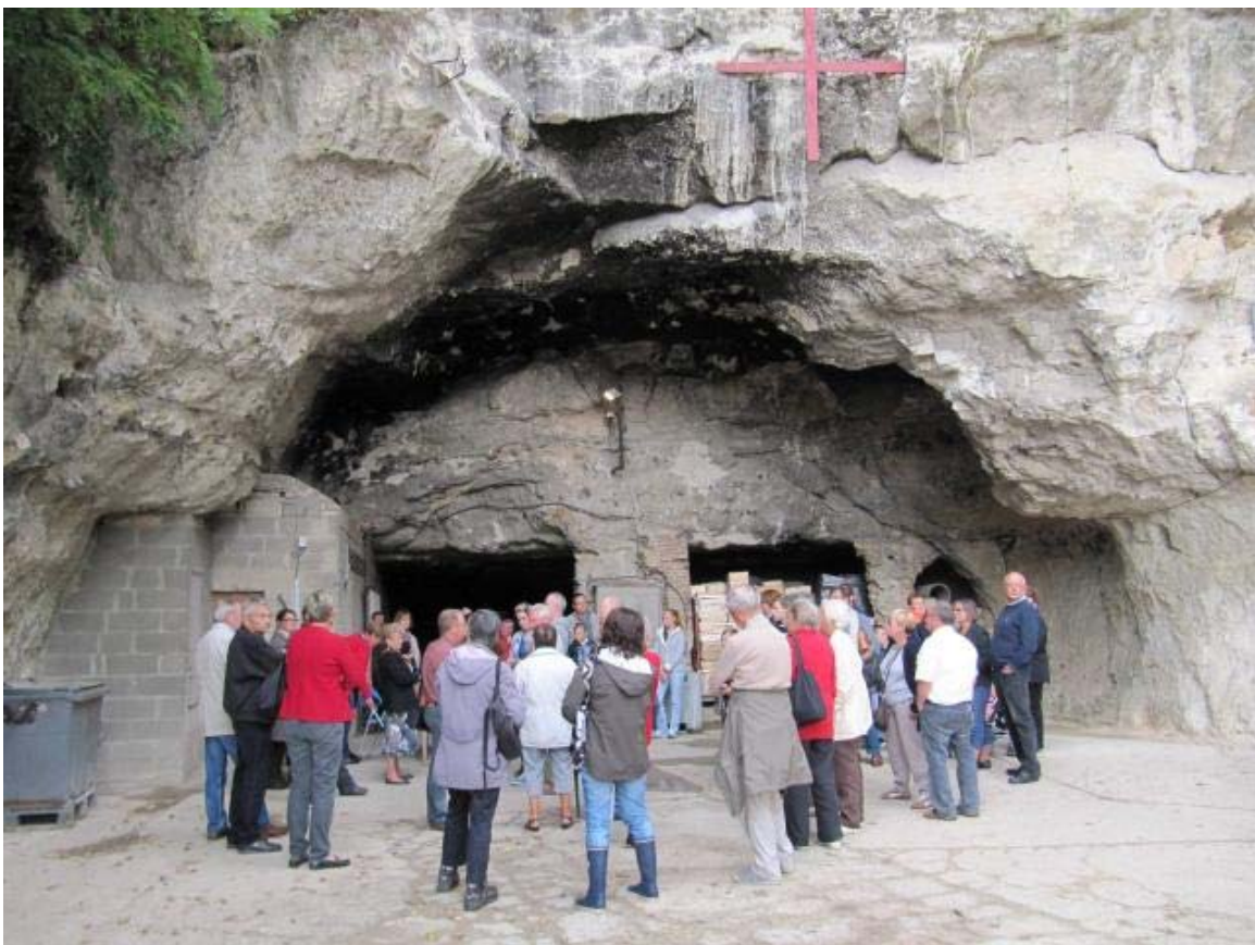
L'entrée de la champignonnière qui accueillit plus de 2 000 personnes en août 1944.

Musée Eugène-Boudin. Peintures et de sculptures du début du XIX e à la fin du XX e siècle. Visite libre : samedi et dimanche, de 10 h à 13 h et de 14 h à 18 h. Ateliers créatifs (10 enfants par atelier, à partir de 5 ans) : samedi et dimanche, de 14 h à 18 h. Visite guidée de l'exposition « Henri et René de SaintDelis » : samedi et dimanche, de 14 h 30 à 15 h 30 et de 16 h 30 à 17 h 30. Tél. 02 31 89 54 00.