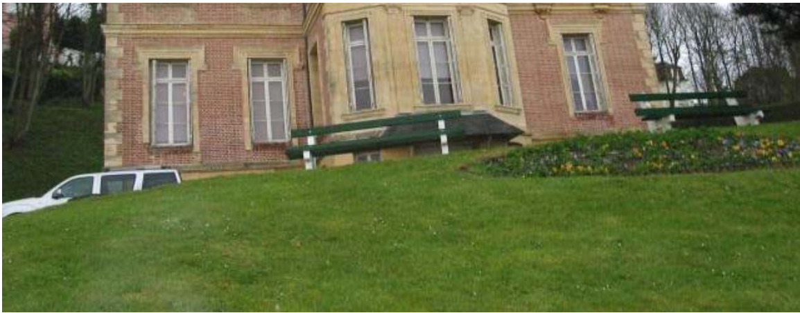
Le musée Villa Montebello, à Trouville.