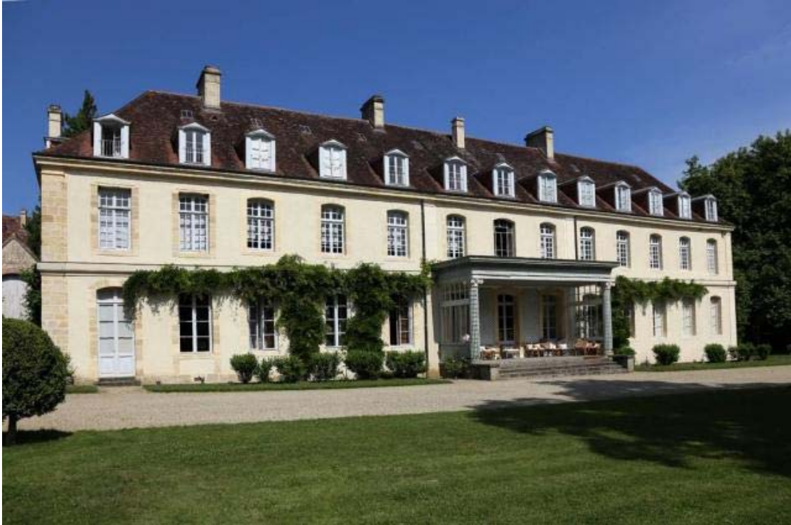
L'ancienne abbaye du Val-Richer, à Saint-Ouen-le-Pin.

Imec abbaye d'Ardenne. Rue d'Ardenne. Exposition « Intérieur » du 40 e anniversaire du Centre Georges-Pompidou : samedi et dimanche de 13 h 30 à 18 h. Visite guidée de la bibliothèque et des archives : samedi et dimanche, de 13 h 30 à 17 h 30. Conférence historique d'Yves Chèvrefils Desbiolles sur l'abbaye d'Ardenne : samedi et dimanche, de 14 h 30 à 15 h 30. Tél. 02 31 29 37 37 - www.imec-archives.com