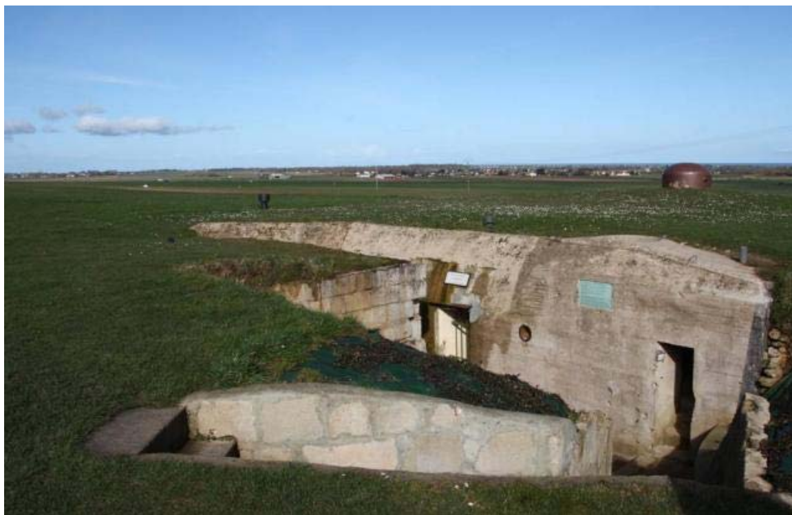
Le site fortifié Hillman se visite ce week-end.

La Glacière souterraine. Sous le square Jeanine-Boitard, à l'angle des rues d'Authie et de Jersey. La Glacière a été construite, il y a environ 160 ans, dans une ancienne carrière d'exploitation de la pierre de Caen. Visite libre : samedi, de 9 h à 13 h.