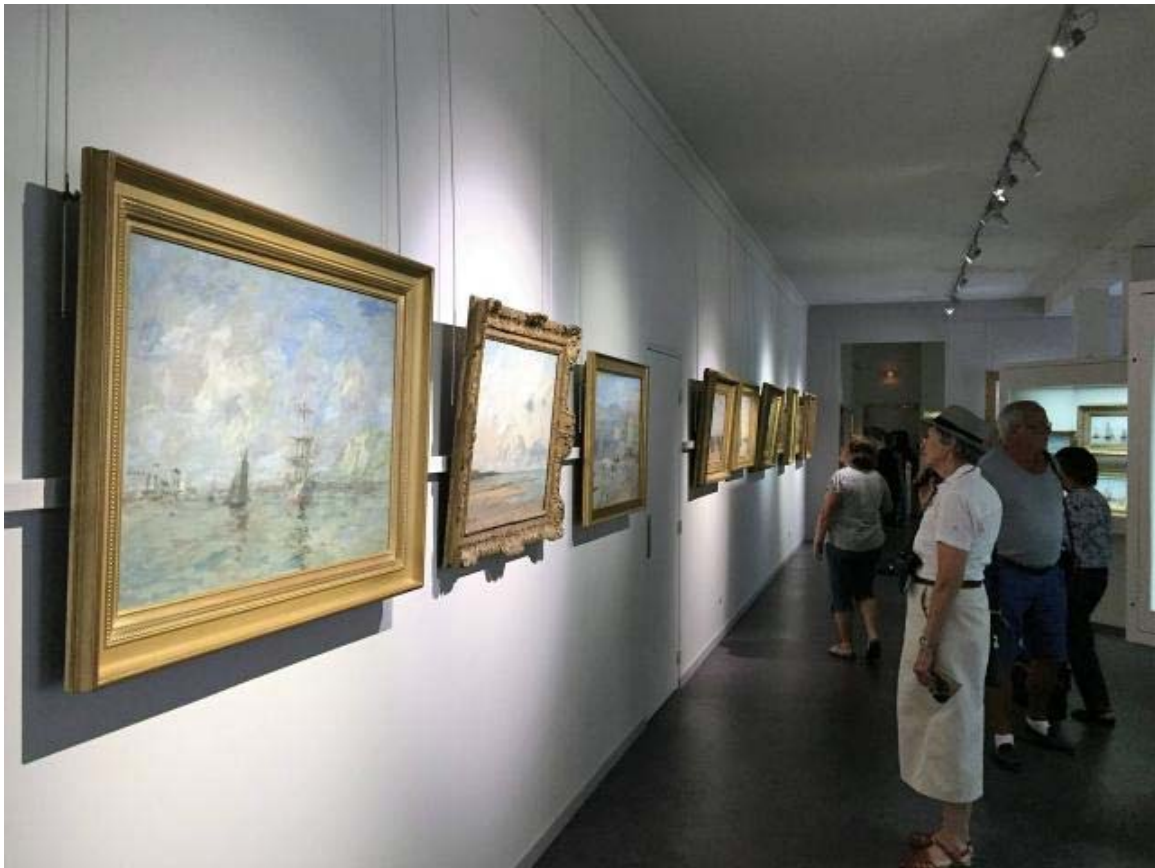
Les musées rouvrent leurs portes ce week-end à Honfleur, comme celui d'Eugène-Boudin.

Mémorial des civils dans la guerre de Falaise. Construit sur les ruines d'une maison détruite pendant l'été 1944. Visite libre : samedi et dimanche, de 9 h 30 à 17 h 30.