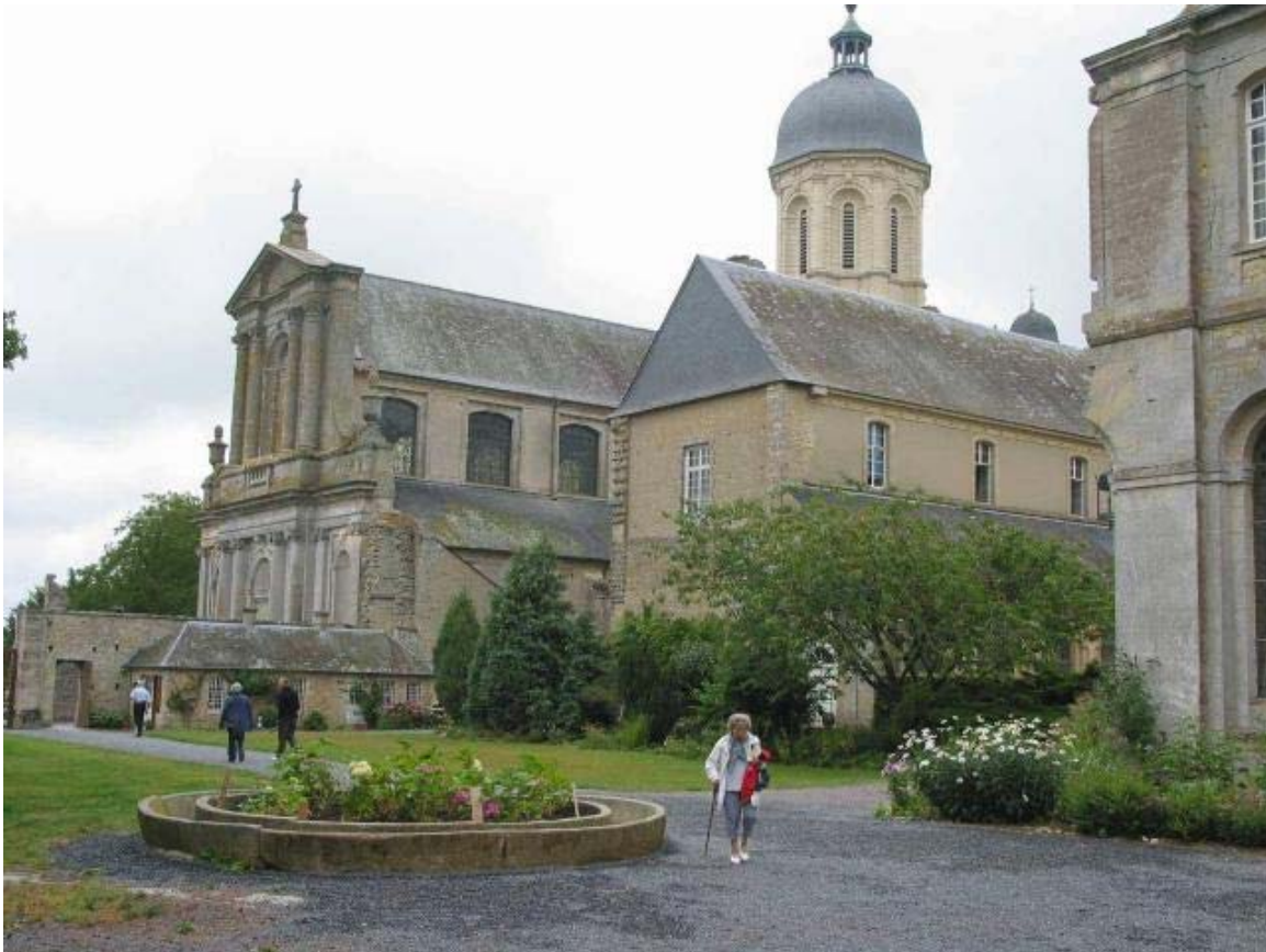
L'abbaye Saint-Martin de Mundaye ouvre ce week-end.

Ornavik. « Les Vikings An 911 ». Domaine de Beauregard. Ornavik est un projet scientifique et pédagogique pour bâtir, forger, tisser, cultiver selon les savoir-faire du Moyen Âge. Visite libre : samedi et dimanche, de 14 h à 18 h 30.