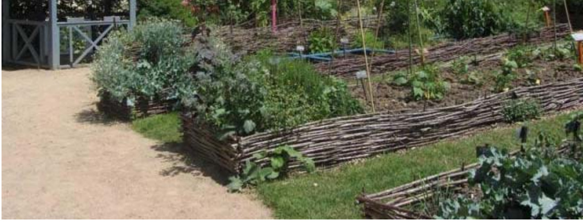
Le jardin conservatoire de l'abbaye de Saint-Pierre-sur-Dives.