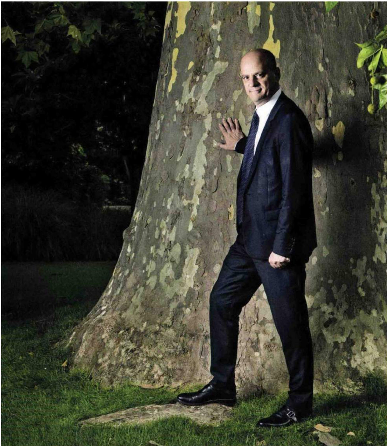
LA RENTRÉE DE M. BLANQUER

Au collège unique, vous préférez substituer un « collège commun ». Si, sous couvert de personnaliser les parcours, la formation varie selon les territoires, les établissements, les enseignants, que reste-t-il de commun en réalité ?