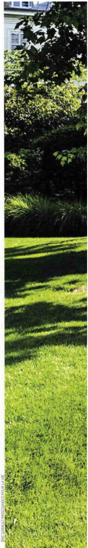
ESC. CASABAT, RENCOUANTO POUR LA VIE