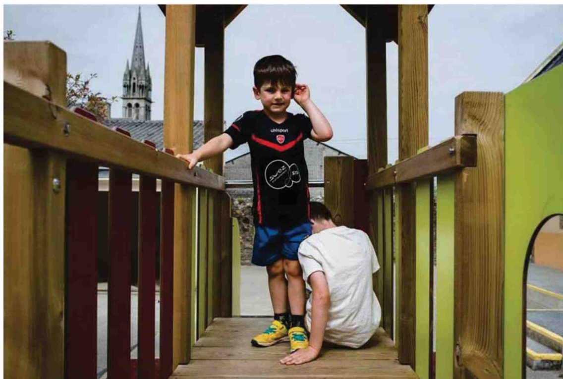
L'école Simone-Veil à Plouénan (Finistère), jeudi.